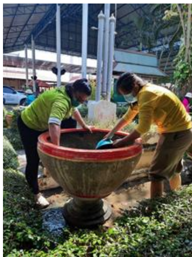
( ภาพประกอบกิจกรรม ๕ส )