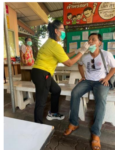
( ภาพประกอบ มาตรการป้องกันการติดเชื้อไวรัสโคโรนา 2019 หรือโรคโควิด 19 )